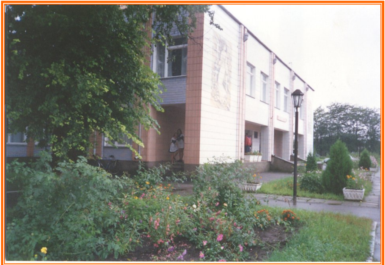
Корпус для молодших школярів Сахнівської школи