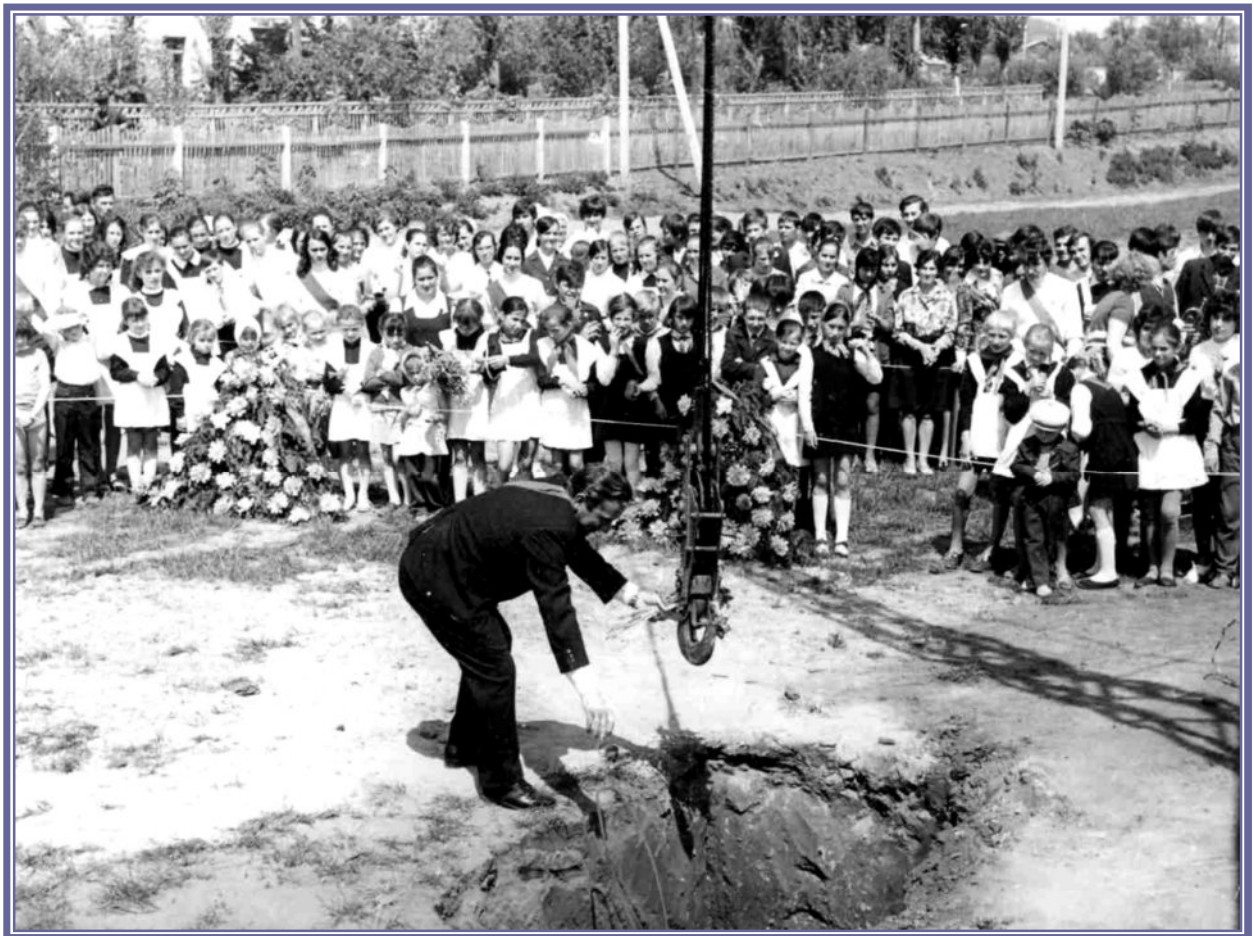
Урочиста лінійка, присвячена початку будівництва «Центру здоров'я»

«Розраховуємо на мудрість»/ “Віче», 1993, № 3, с. 96-99