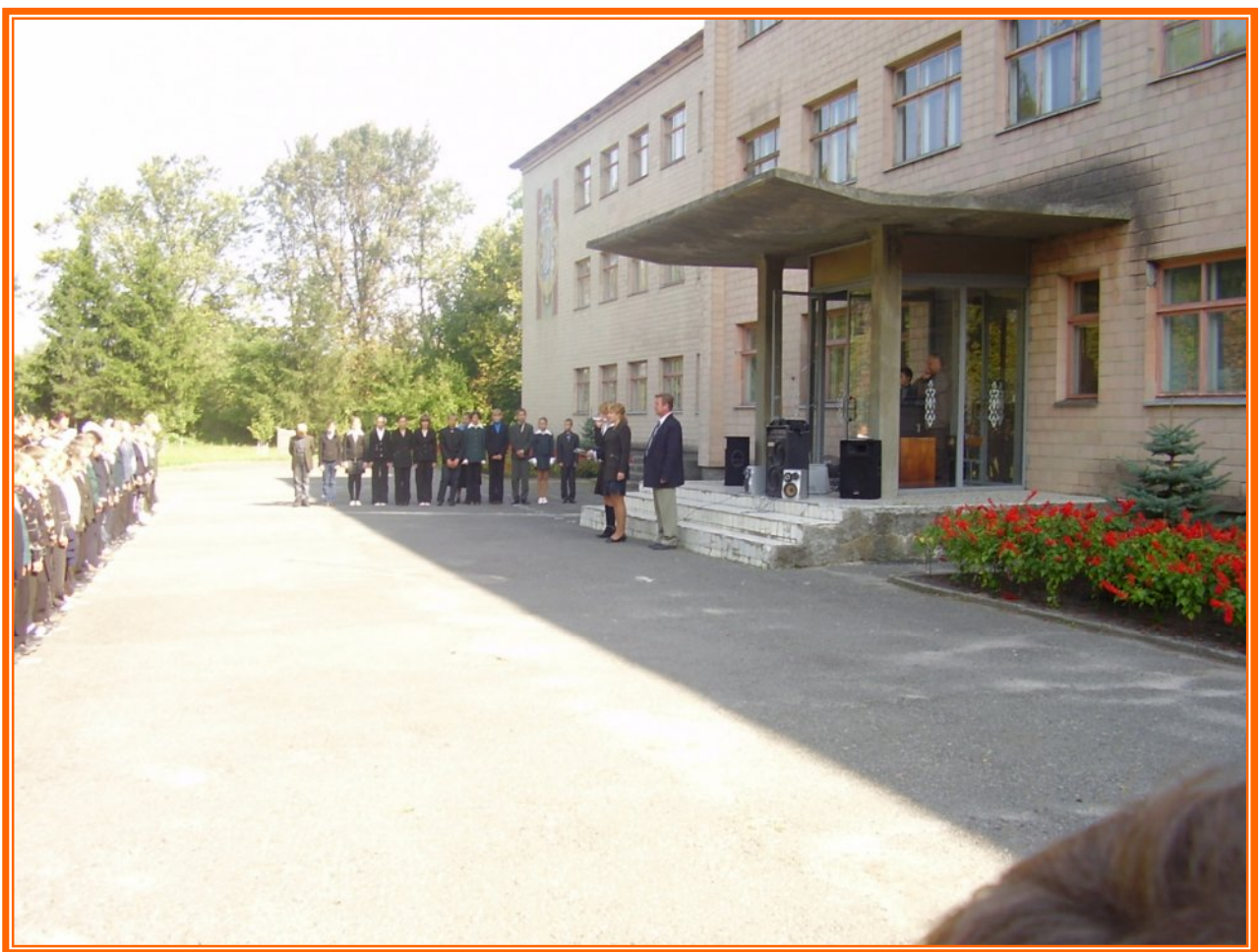
Традиційна лінійка у Сахнівській школі

«Грані творчості» (кн .для вчителя) К., 1990, с. 7-24